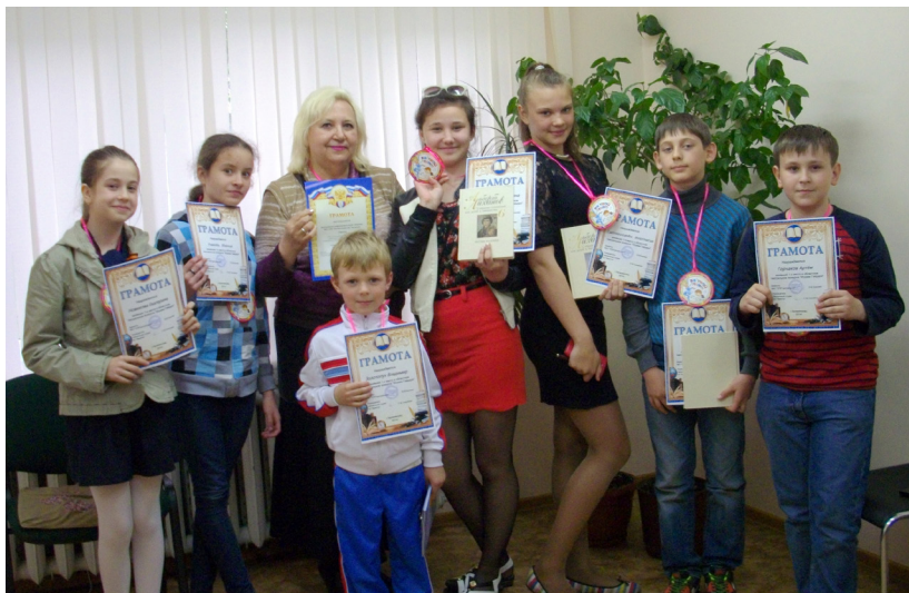
Ребята из театральной студии «Янтарики», ставшие победителями областного конкурса «Играем Гайдара» в 2014 г.