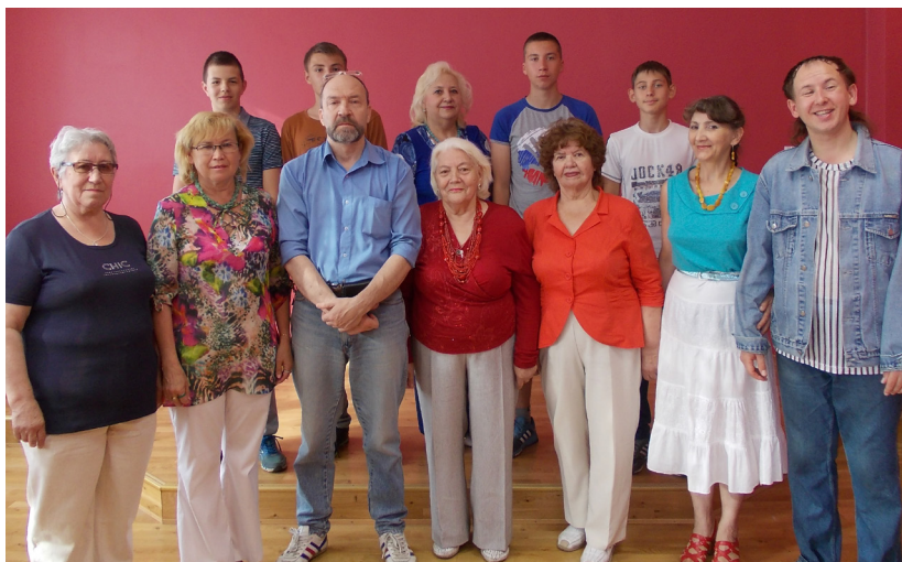
В гостях у поэтов ребята школы №11.